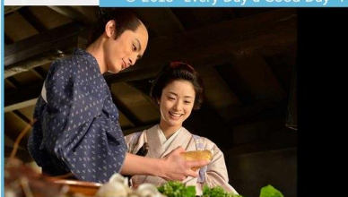
A Tale of Samurai Cooking