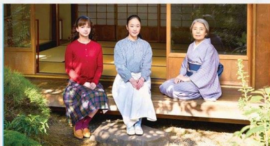
Every Day a Good Day

© 2018 "Every Day a Good Day" Production Committee