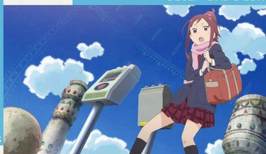
Pop in Q