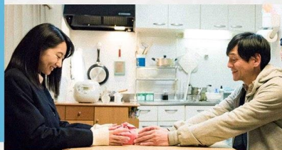
Dad's Lunch Box

© 2018 "Every Day a Good Day" Production Committee